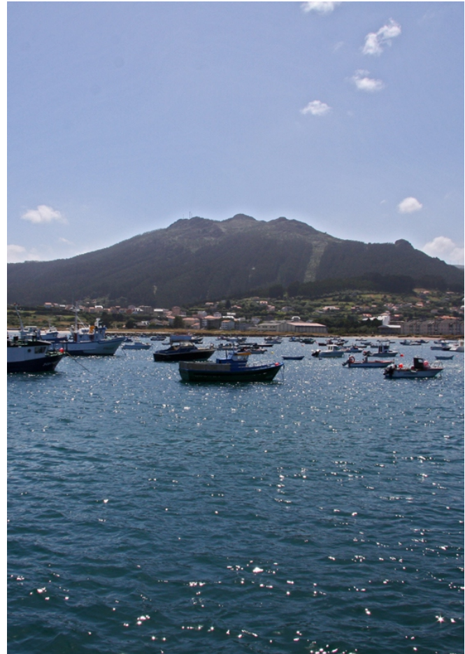
A Miranda desde o porto de Cariño