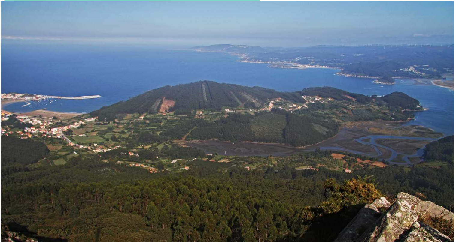
A ría de Ortigueira co monte Mazanteo no primeiro plano