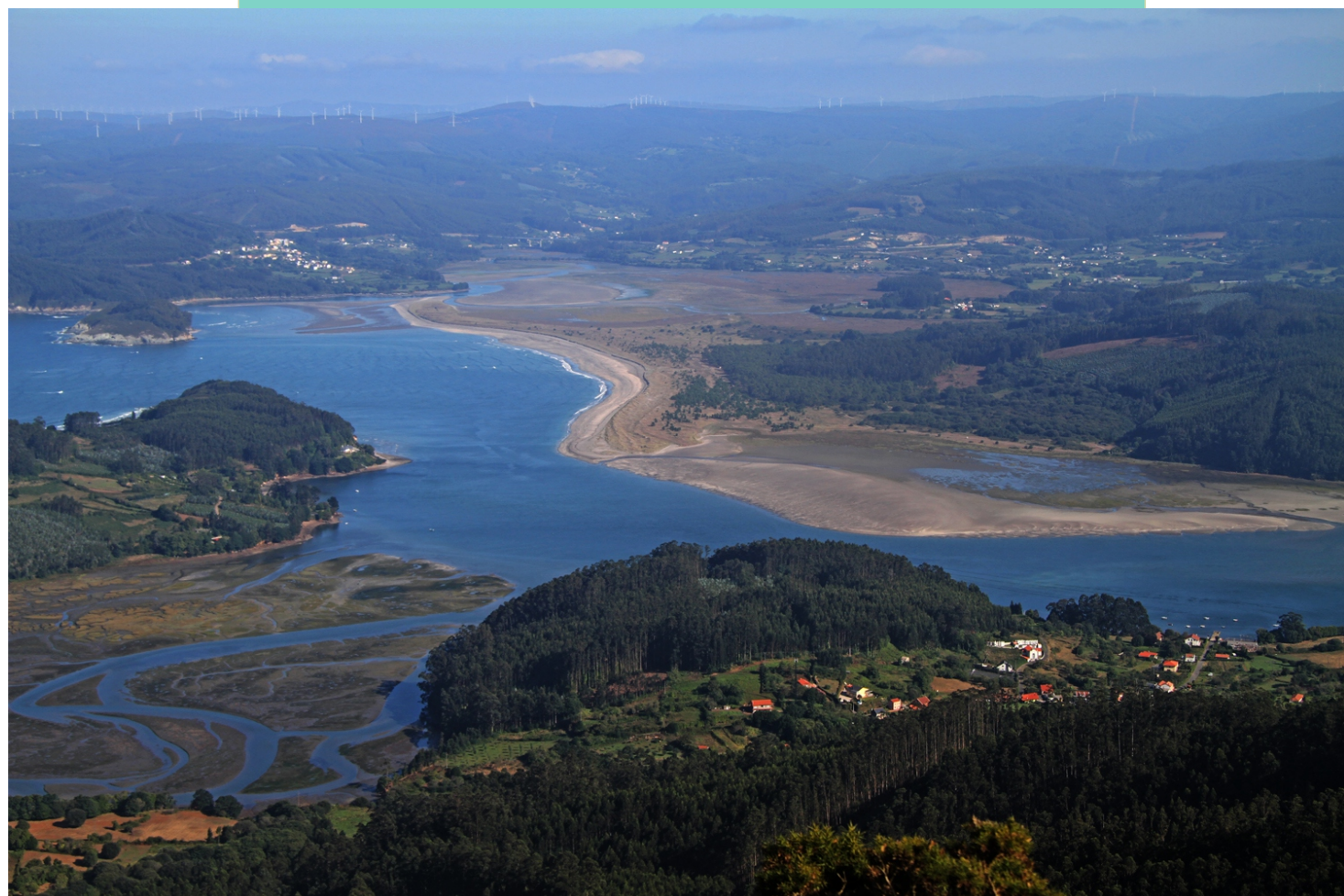
Praias de Ortigueira. No primeiro plano o esteiro do Lourido e as puntas do Frade e de Sismundi.