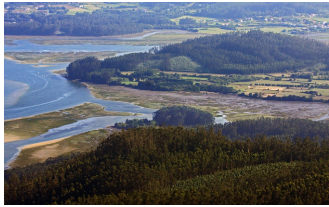
Enseada do Esteiro e punta Fornelos

Ao miradoiro podemos acceder a pé, en bicicleta, aínda que as pendentes pola parte de Landoi son para poñer a proba a capacidade de escalada, ou en vehículo de motor, por dous camiños: o principal, sinalizado, saíndo de Cariño pola estrada que vai ao Santo André de Teixido, a uns 5 km, atopamos un cruzamento con varios sinais que nos leva pola dereita aos cantís e ao miradoiro do Limo e pola esquerda, en 4,5 km, á Miranda; ou saíndo de Cariño cara a Ortigueira, pasado Sismundi, hai un desvío á dereita que vai a Landoi e meténdonos nel uns 500 m, en Cabanán, atopamos outro desvío á dereita que, por unha estrada estreita e encosta con fortes pendentes, nos conduce, en 3 km, ao pequeno espazo que hai para aparcar ao pé do acceso ao miradoiro. Desde ahí só nos faltan uns 100 m de camiñada por un trazado ben acondicionado para descubrir, case de súpeto, ao pé das antenas de telefonía, unha panorámica de impresión.