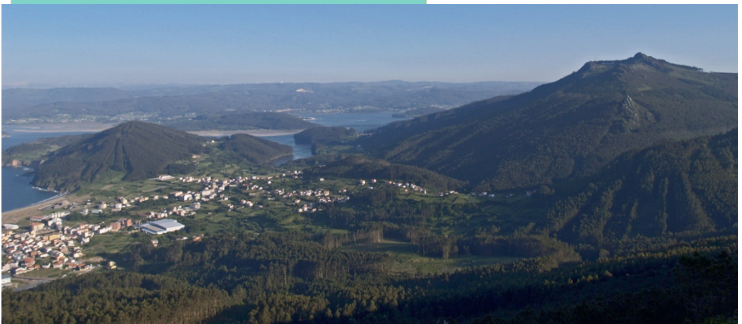
A Miranda ao pé do Penido do Frade, coa ría de Ortigueira