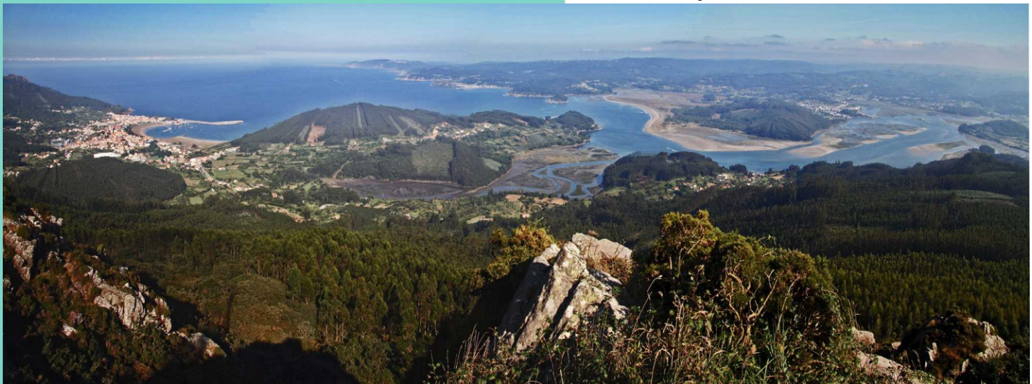
Vista da Ría de Ortigueira

Un punto de visita obrigada para calquera que se achegue á vila de Cariño. Un espectacular balcón a case 500 m de altura e unha caída de forte desnivel sobre o litoral, que abrangue a vila de Cariño e a súa contorna, toda a liña de costa ata a Estaca de Bares, incluídos case todos os recantos e reviravoltas da ría de Ortigueira -un espazo que polas súas particulares características e a súa situación estratéxica nas liñas de paso dos bandos de aves migratorias (é un dos primeiros lugares nos que atopan condicións axeitadas para o repouso e a alimentación despois de faceren a travesía do mar desde o norte de Europa) está protexida como Humidal Ramsar, ZEPA e LIC/ZEC-; e unha panorámica dos altos e da cara leste da serra da Capelada.